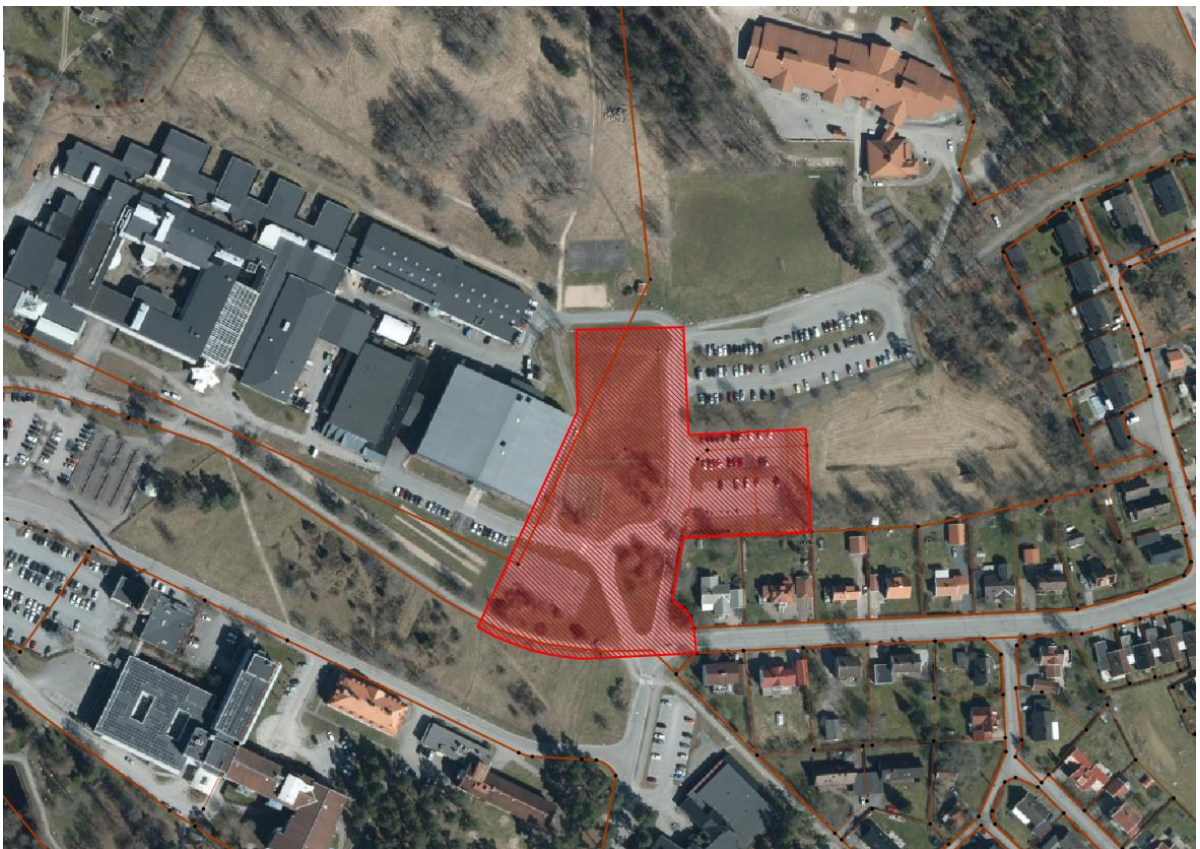
Figur 1: Planområdets avgränsning markerad med röd skraffering