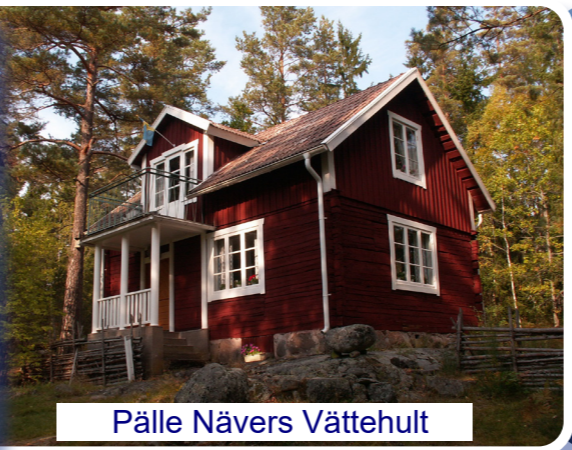
Pälle Nävers Vättehult