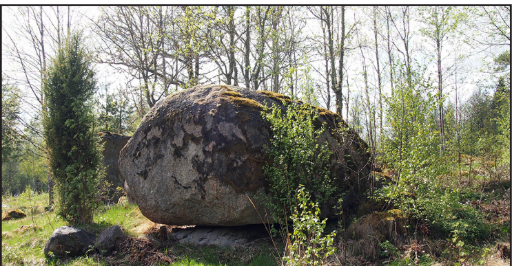
Flyttblocket mellan Mågebo och Hjärtaryd som kallas Jättastenen.

390 m längre fram svänger vi vänster. I ett öppet kulturlandskap passerar vi byarna Mågebo och Klackenäs (220 möh). Efter 1 870 meter ligger på vänster sida inne i en trädgård strax efter en liten bäck ett flyttblock kallat Jättastenen (6) (se infotavla).