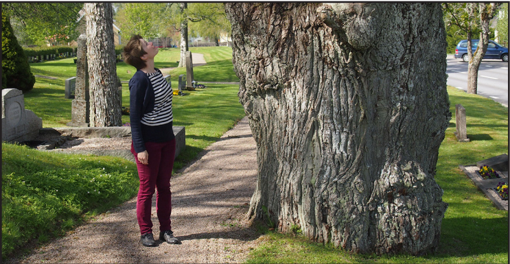
En av de stora ekarna på Korsberga kyrkogård.

Vi startar vid Korsberga torg (1) (245 möh) och cyklar i nordlig riktning på väg 31, där vi efter 490 m passerar Korsberga skola. Strax därefter ligger Korsberga hembygdsgård på vänster sida, som består av en knuttimrad parstuga från början på 1800-talet. Här finns även en lada och en bod från samma tid samt en enkelstuga från 1800-talets mitt. Efter ytterligare 150 m finns entrén till Korsberga kyrka (2) (se infotavla och fördjupad text).